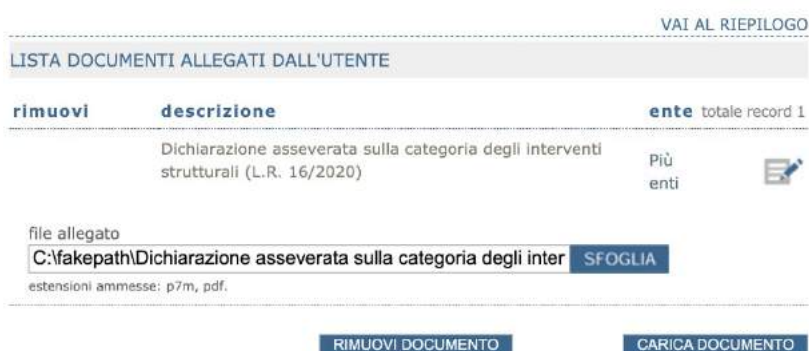
Figura 7 - la dichiarazione asseverata di appartenenza ad una delle tre tipologie

Per allegare alla pratica ulteriori moduli non suggeriti automaticamente dal sistema, utilizzare la sezione "Modulistica non collegata alla pratica" presente in questa pagina.